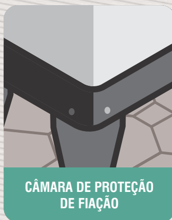
CÂMARA DE PROTEÇÃO DE FIAÇÃO