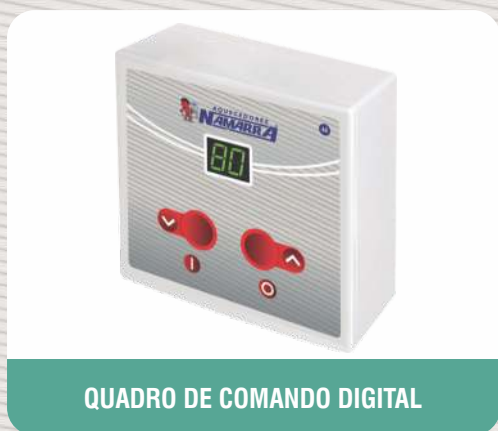
QUADRO DE COMANDO DIGITAL

● ENTRADA DE AR FRIO ● SAÍDA DE AR QUENTE